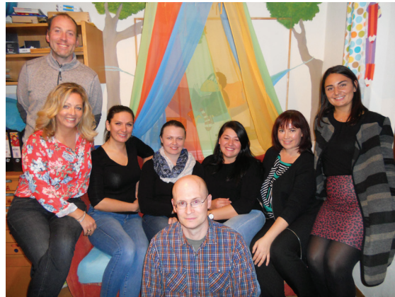
Für den Elternbeirat

Als größtes Event steht nun die Planung des Frühlingfestes an. Wie beim letzten mal bereits erwähnt, ist es dieses Jahr ein besonderes Fest, da die KiTa ihr 25-jähriges Jubiläum feiert. Dies soll in einem gebührenden Rahmen geschehen und somit beginnt die Planung schon weit im Voraus, da dieses Fest einen schönen Abschluss auch für das KiTa-Jahr sein soll und sich die Kinder und ihre Eltern lange daran erinnern sollen.