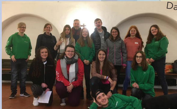
Abenteuertag Buß- und Betttag 2019

Abenteuertag im Gemeindehaus Auferstehungskirche